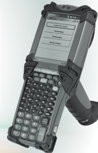
Datenerfassungsgerät mit einer von Boss Info entwickelten Applikation

Die Lagerplatzentnahmen und -einlagerungen werden zeilenweise angezeigt und durch Scannen der Barcodes durch den Lagermitarbeiter bestätigt. Die erfassten Lagerbewegungen werden mit Benutzer-ID, Datum und Uhrzeit direkt in die Datenbank geschrieben. So eliminieren Sie Fehlerquellen und beschleunigen Ihre Prozesse im Lager.