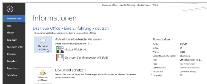
Verwenden Sie Lync in Ihren Office Applikationen, um schneller und einfacher zu kommunizieren.